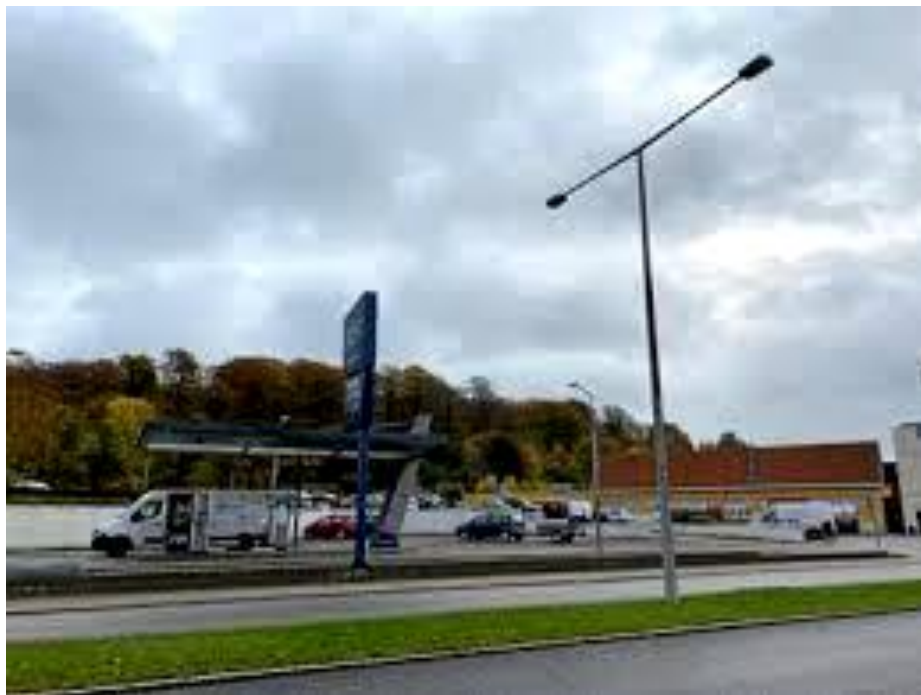
Som der ser ud i dag med kik til skoven (arkivfoto)

Som født og opvokset i området vil jeg ikke stå i vejen for udvikling og nytænkning af Frederiksværk, men jeg ønsker at bevare og ikke ødelægge en unik og fin bymidte. Derfor kommer jeg ikke til at stemme for stort byggeri på dette område.