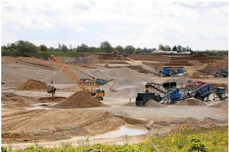
Der graves efter råstoffer. Hvem vil være nabo til det? (arkivfoto)

Jeg vil gøre, hvad jeg kan for at få en ny og mere tidssvarende Råstoflov - en lov der tager højde for, hvor istiden har begunstiget landet med ressourcer, og som også tager højde for regionsgrænsedragningen fra kommunalreformen i 2008, hvor 1/3 af landets befolkning kun fik 6% af Danmarks areal. Der skal også være plads til en kompensation i lighed med, hvad der gives, hvis man bliver nabo til en vindmølle, en solcellepark eller en højspændingsledning.